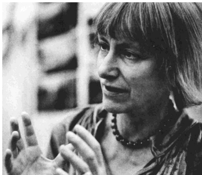
tekening boven: Etty Hillesum (1914-1943) foto onder: Dorothee Sölle (1929-2003)