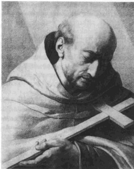
boven: Teresa van Avila onder: Jan van het Kruis