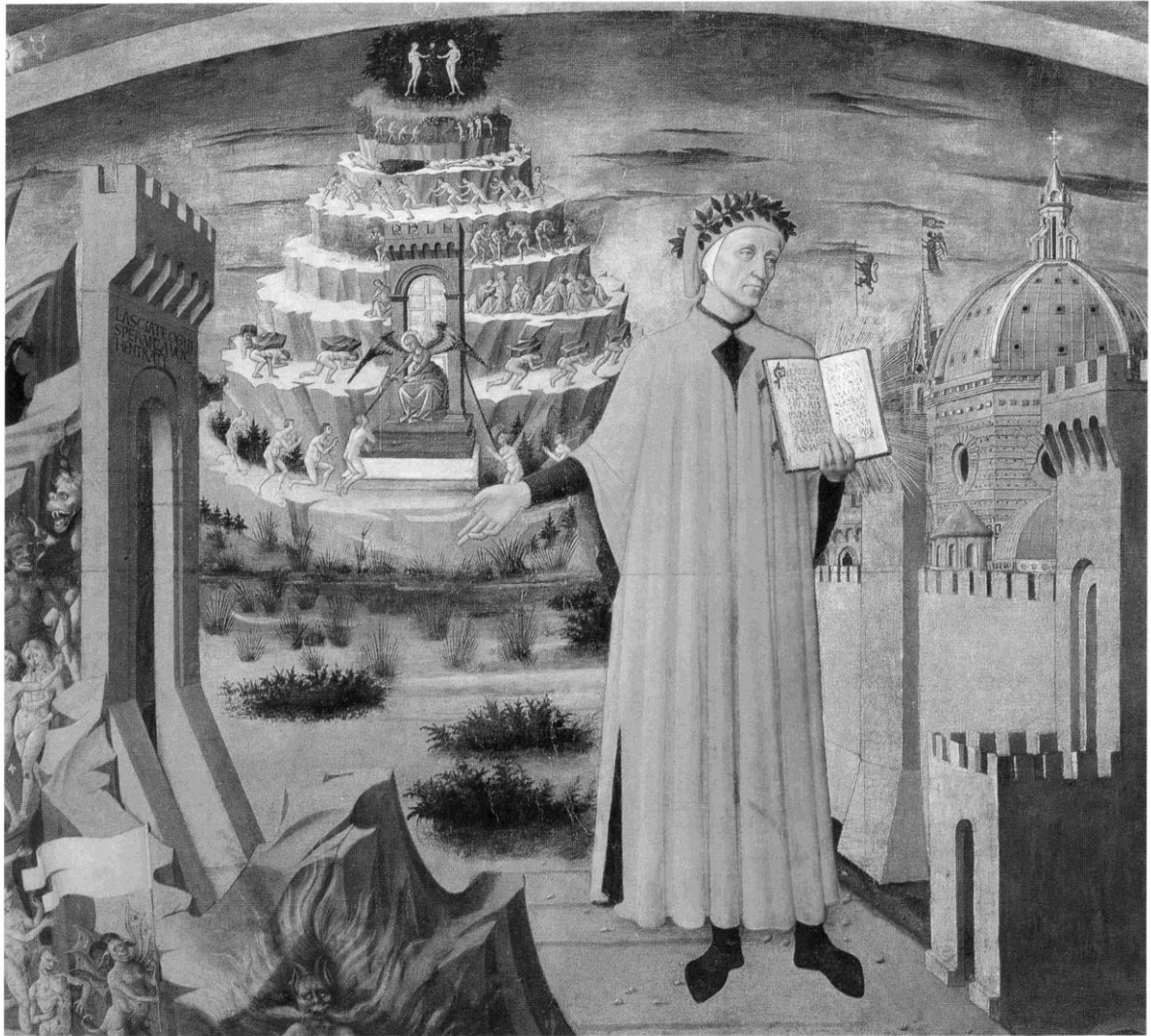
Dante Alighieri (fresco, Dom van Florence, 1465)