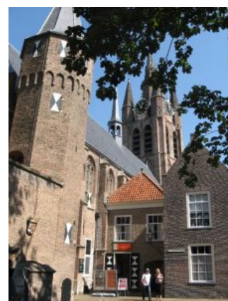
Delft, St. Agathaconvent (Tertiarissen, waarin later gevestigd werd de Prinsenhof)

Op ontdekkingsreis langs al die Moderne Devotie locaties ontdek je bijzondere zaken. Bezig met de Schieland, Delfland en Westland Devotie route kwam ik achter het feit dat Prins Willem van Oranje zeker twaalf jaar in het Tertiarissenconvent St. Agatha te Delft heeft gewoond en daar uiteindelijk