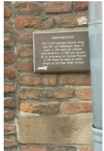
Utrecht, St Agnesconvent (Zusters, vanaf 1422 (!) Tertiariessen), waarin later gevestigd werd het Centraal Museum

De nieuwsbrief Collatie bevat informatie over de Moderne Devotie vanuit verschillende invalshoeken. Zo wordt er aandacht besteed aan historisch onderzoek en aan de betekenis van de Moderne Devotie als erflater voor onze cultuur en samenleving. Daarnaast wil Collatie een bescheiden platform zijn voor hen die heden ten dage streven naar innerlijke vernieuwing.