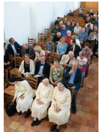
Voor de boekpresentatie was veel belangstelling

Museum Geert Groote Huis te Deventer heeft naar aanleiding van de verschijning van het nieuwe overzichtswerk De Moderne Devotie een tentoonstelling ingericht, waarin het boek en de Moderne Devotie centraal staan. Deze reizende tentoonstelling is tot 27 januari 2019 in Deventer te bezichtigen. Daarna verhuist de tentoonstelling naar Zwolle, waar deze in het Historisch Centrum Overijssel onderdak zal vinden. Adres: Museum Geert Groote Huis, Lamme van Dieseplein 4, 7411 LX Deventer, 0570 85 89 99, info@geertgrootehuis.nl , geopend: woensdag tot en met zaterdag: van 11.00 uur tot 16.00 uur, zondag: van 13.00 uur tot 16.00 uur. Meer informatie vindt u hier: http://www.geertgrootehuis.nl/agenda/expositie-moderne-devotie/