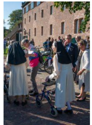
De Zusters van Soeterbeeck arriveren bij de boekpresentatie